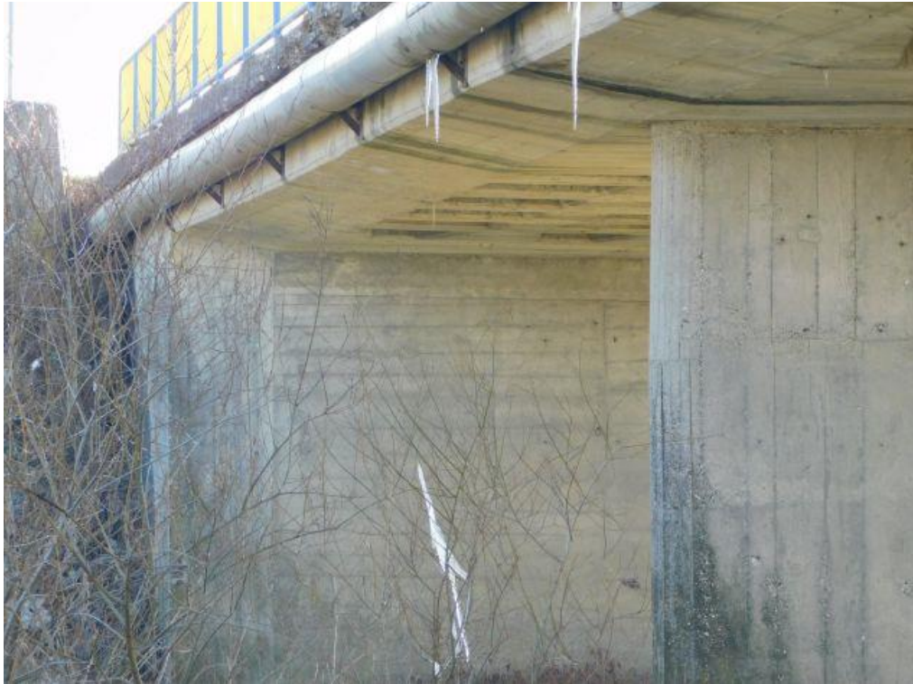
Slika 2. Pogled na upornjak