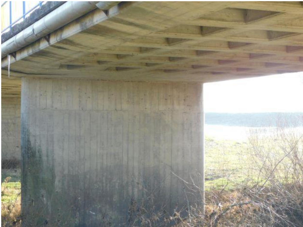
Slika 1. Pogled na rasponsku konstrukciju mosta