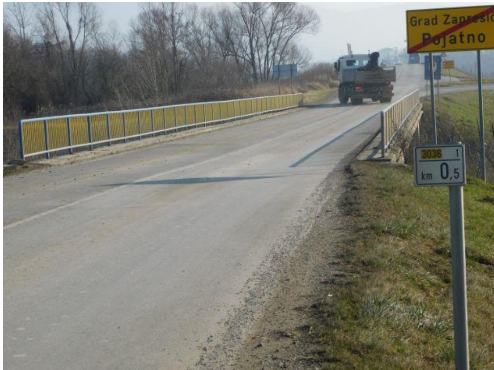
Slika 1. Pogled na prometnu površinu mosta

Mostom Pojatno, županijska cesta ŽC 3036 prelazi preko korita vodotoka. Most je izveden kao kontinuirana upeta rasponska ploča preko 4 polja. Ploča je oslonjena oslonjena i upeto povezana sa stupovima i upornjacima. Stupovi i upornjaci su masivni armiranobetonski elementi. Preko mosta prelazi veći broj komunalnih instalacija. Na gornjem ustroju izveden je asfaltni kolnički zastor sa dva prometna traka i pješački hodnici s pješačkim ogradama.