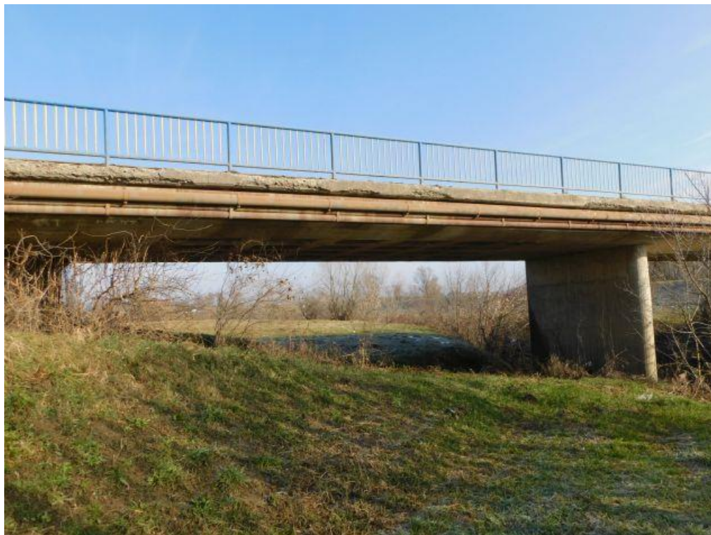
Slika 4. Pogled na most i korito vodotoka

Copying, reproduction or any use not in conformity with the intended application and without consent of the URBANE IDEJE d.o.o., Samobor, limited liability company is not permitted.