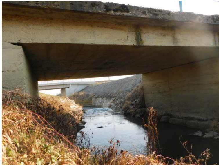
Slika 4. Pogled na most i korito vodotoka