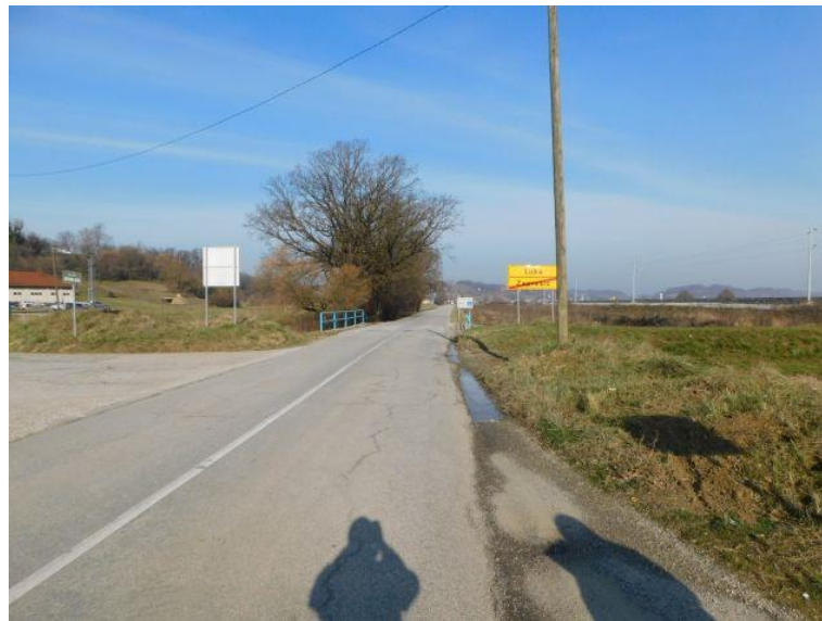
Slika 1. Pogled na prometnu površinu mosta

Mostom Luka (prometnica ŽC 2195) premošćuje se kanal. Gornja konstrukcija mosta je AB ploča izvedena na upornjacima s paralelnim krilima. Na mostu je ugrađena pješačka ograda, bez odbojne ograde. Revizijske staze su izvedene iznad nivoa kolnika. Preko mosta prelazi veći broj komunalnih instalacija.