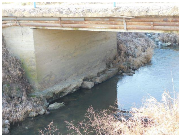
Slika 2. Pogled na upornjak