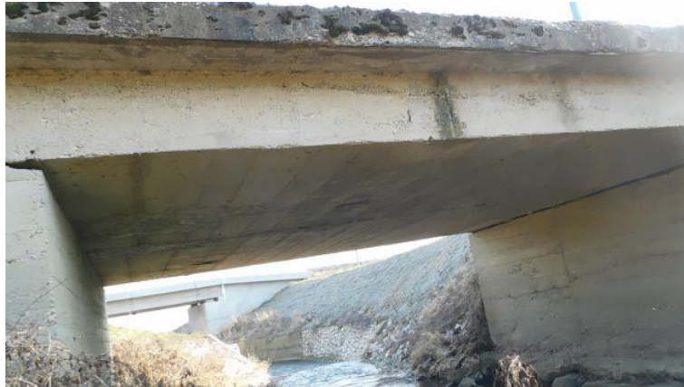
Slika 1. Pogled na rasponsku konstrukciju mosta

Umnožavanje, preštavanje i upotreba izvan namjene i bez odobrenja URBANE IDEJE d.o.o., Samobor nije dopušteno.