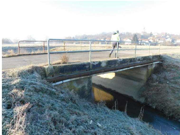
Slika 4. Pogled na most i korito vodotoka