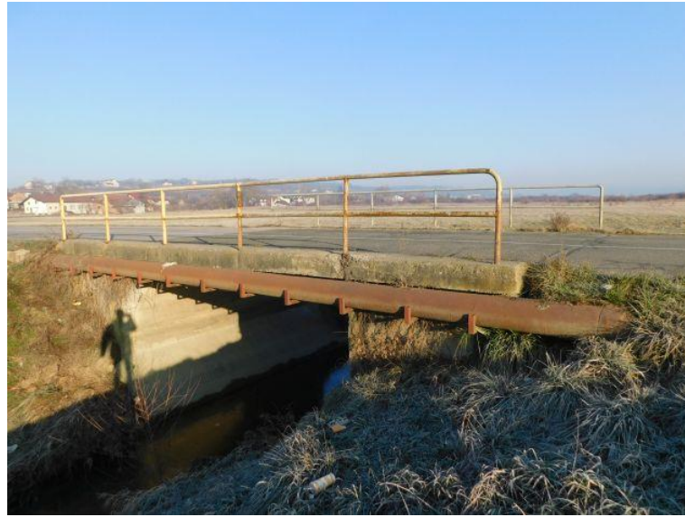
Slika 1. Pogled na rasponsku konstrukciju mosta

Umnožavanje, preštisk i upotreba izvan namjene i bez odobrenja URBANE IDEJE d.o.o., Samobor nije dopušteno.