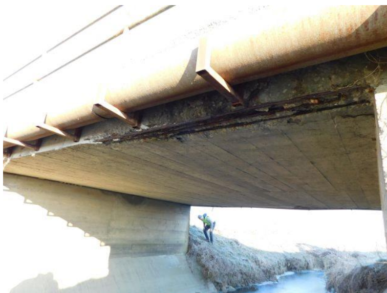
Slika 2. Pogled na upornjak