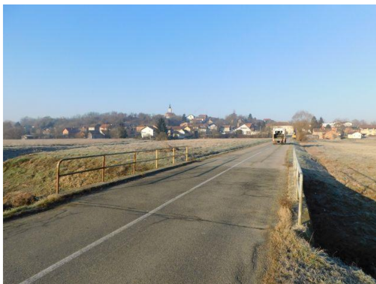
Slika 1. Pogled na prometnu površinu mosta

Mostom Tomaševac prometnica ŽC 3002 premošćuje kanal. Gornja konstrukcija mosta je AB ploča izvedena na upornjacima s paralelnim krilima. Asfaltni kolnik je u lošem stanju. Revizijske staze ne postoje, nego su izvedeni zidići na kojima je ugrađena pješačka ograda, bez odbojne ograde.