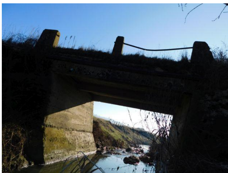
Slika 2. Pogled na upornjak

Copying, reproduction or any use not in conformity with the intended application and without consent of the URBANE IDEJE d.o.o., Samobor, limited liability company is not permitted.