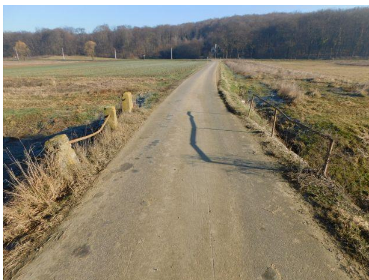
Slika 1. Pogled na prometnu površinu mosta

Most Novakovec Bisački na prometnici LC 31002 na stac. km 4+052 premošćuje se kanal jednim rasponom. Rasponska konstrukcija mosta je AB ploča i AB grednici oslonjeni direktno na masivne betonske upornjake s dijagonalnim krilima. Pješački hodnici nisu izvedeni propisanih dimenzija, već samo betonski zidići na rubovima rasponske ploče. Pješačka ograda je ugrađena na betonske stupiće dok odbojna ograda nije ugrađena.