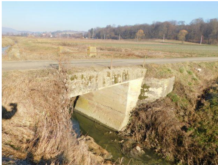
Slika 4. Pogled na most i korito vodotoka