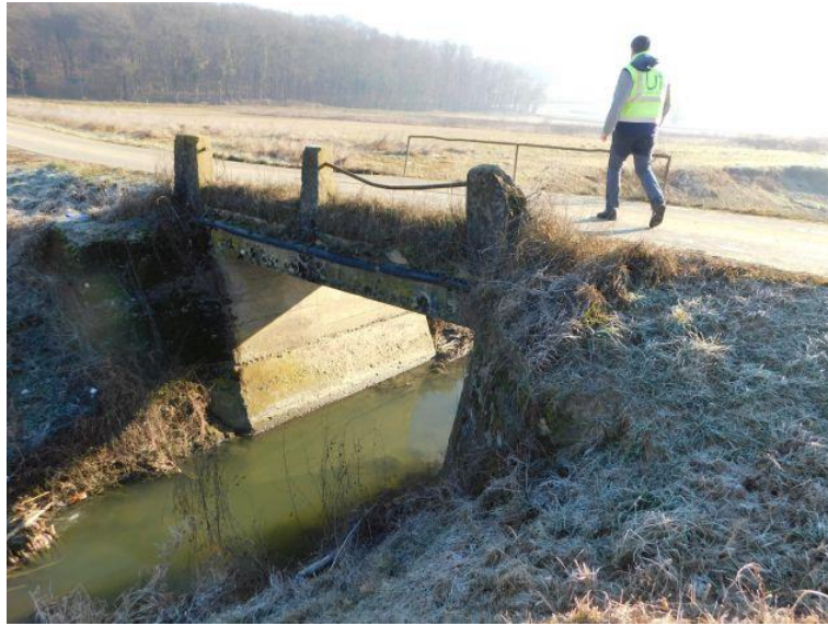
Slika 1. Pogled na rasponsku konstrukciju mosta