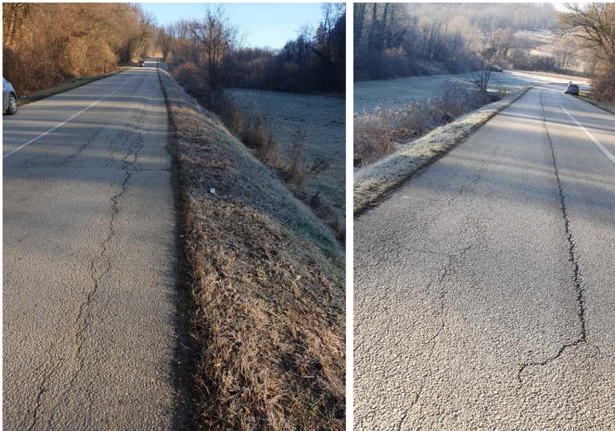
Slika: S pribriježne strane jarak zadržava vodu; Čelo klizišta na kolniku