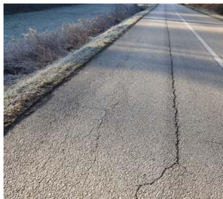
Slike: Županijska cesta ŽC 3002; Stacionaža: 1+920; Pukotine; Čelo cestovnog klizišta