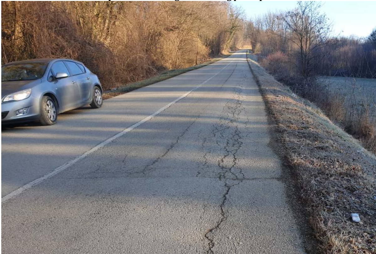
Županijska cesta ŽC 3002; Stacionaža: 1+920